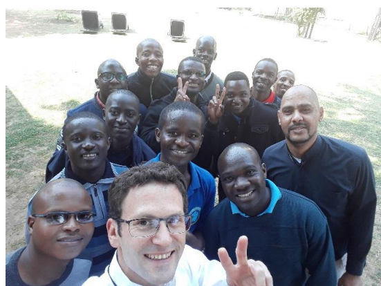
S novici a formátory

Mým prvním úkolem v africké misii je tedy, jak se zdá, obrnit se trpělivostí, modlit se a učit se důvěřovat Pánu. Ale protože jsem tu uprostřed své oblátské rodiny,