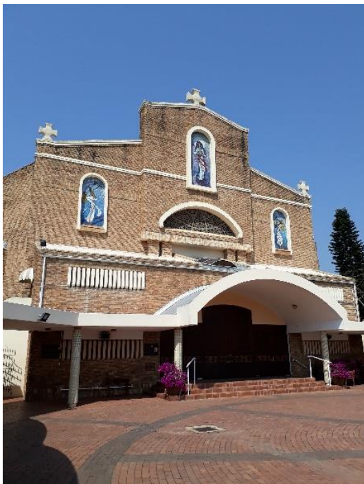
Kostel v Pinetownu

li vidět více fotek s popisky, přejděte na odkaz dole.