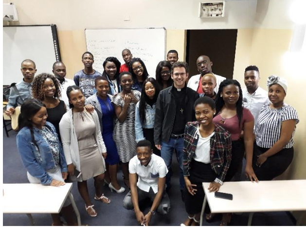
Po mši se studenty

Ale abych napsal také něco o sobě, o tom, co dělám a jak se mi daří. Snažím se být nějak užitečný tam, kde jsem - ve farnosti St. Anne v Durbanu. Slavím mše sv. ve farnosti, u sester dominikánek nebo také v domově důchodců a se studenty na univerzitě. Farní mše jsou od úterý do pátku v 6 hodin ráno, takže jsem si musel nejdřív trochu přeštelovat své vnitřní hodinky, ale teď už jsem si zvykl. Slunce tu stejně vychází v pět a zapadá v šest a lidé jsou zvyklí vstávat a jít do práce dřív (a předtím ještě stihnout tu mši sv.). A po setmění není radno vycházet na ulici, zvláště ne bílému cizinci. Kromě reálné hrozby únosů jsou tu drogové gangy, které si občas na ulici vyřizují účty. Střelba se tu večer ozývá tak jednou týdně. Drogy zasahují do života mnoha rodin z farnosti.