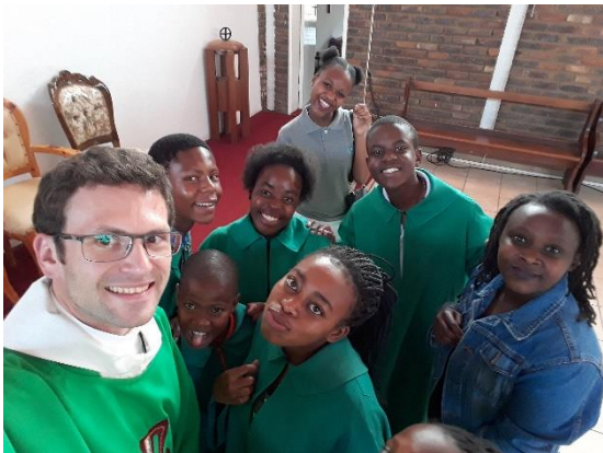
S ministranty v Thembiso

Africe a v Lesothu. Obláti včetně oblátských biskupů tu stáli na straně chudých a utlačovaných. Jsem na ně hrdý.