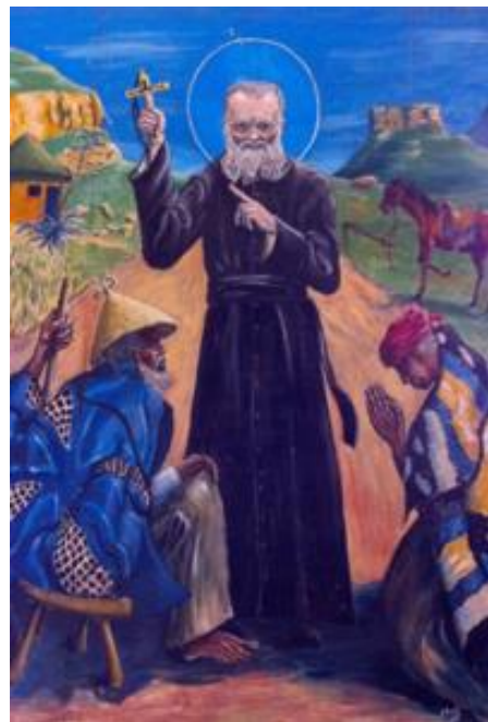
Bl. Joseph Gérard OMI